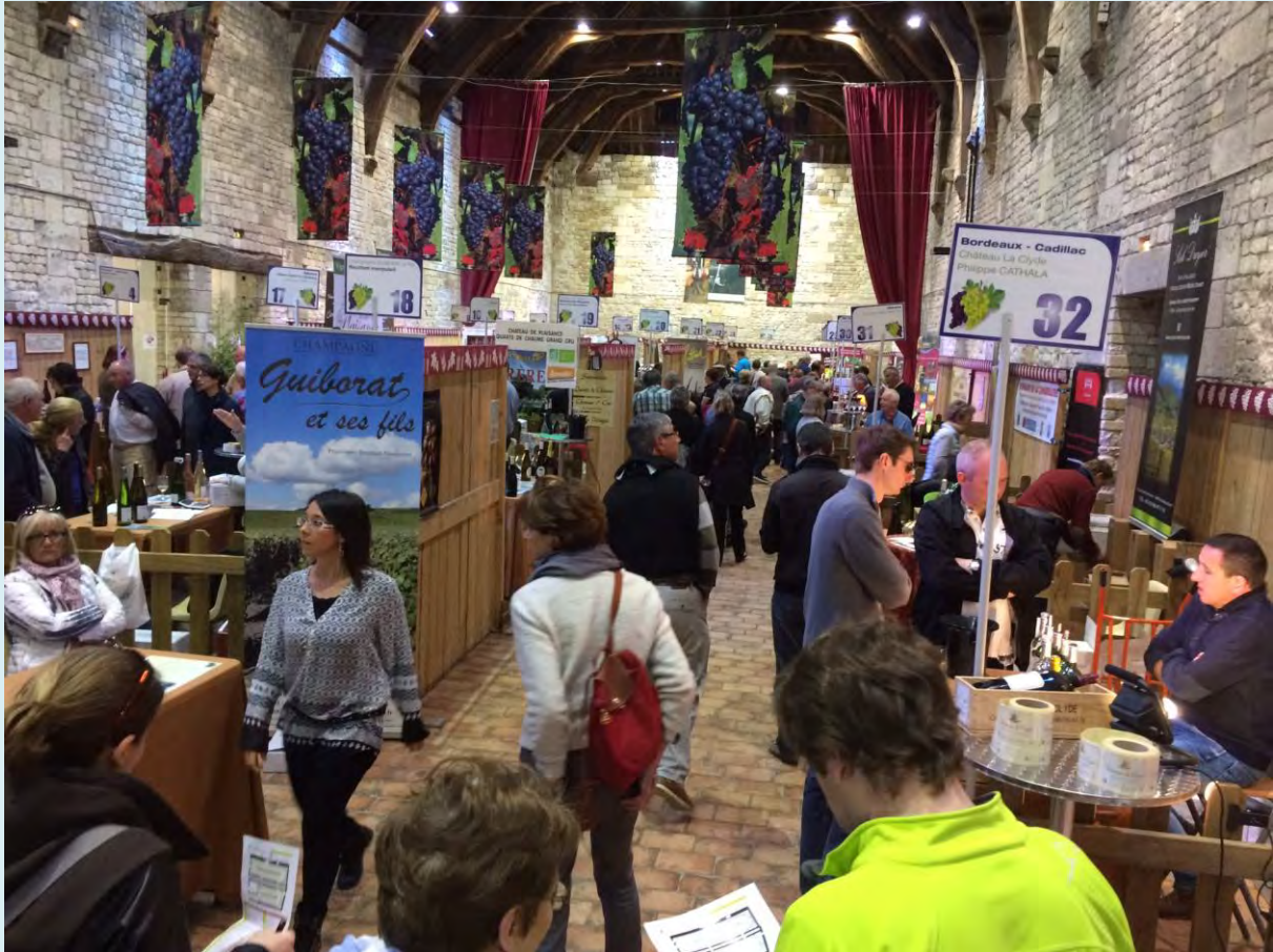
Vue du Grand Grenier à sel

L'ABUS D'ALCOOL EST DANGEREUX POUR LA SANTE A CONSOMMER AVEC MODERATION