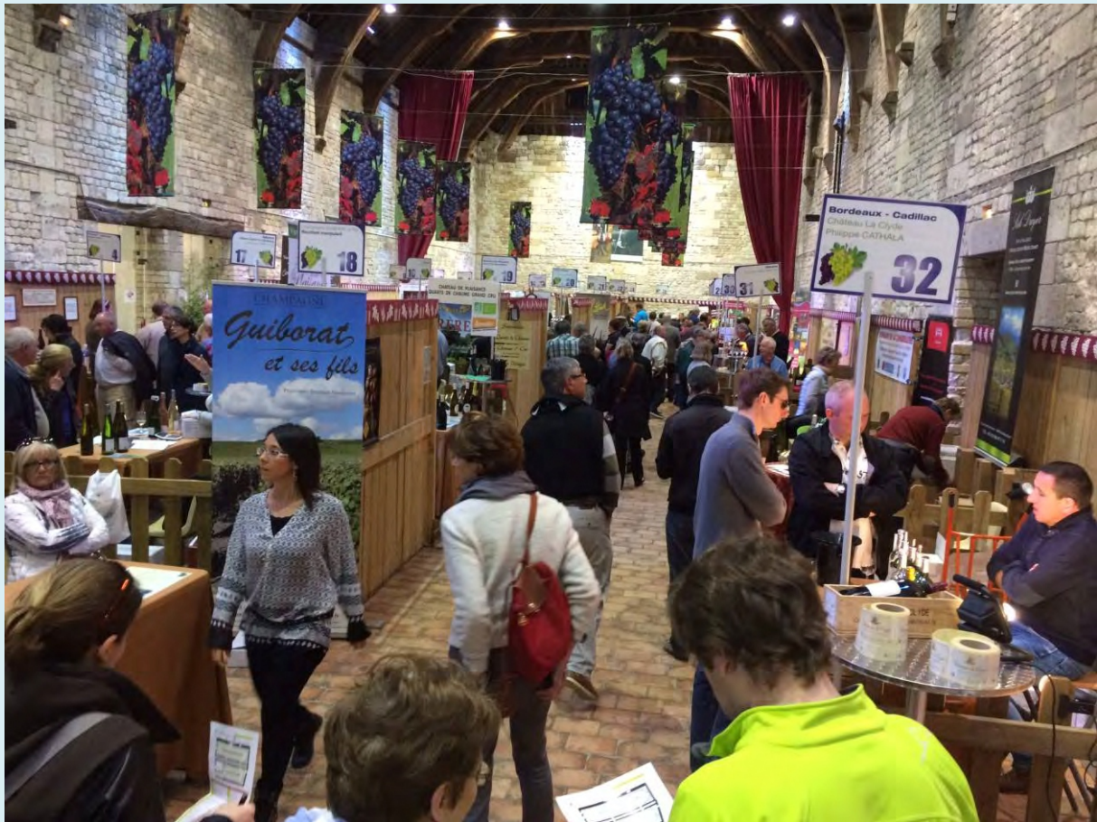
Vue du Grand Grenier à Sel

L'ABUS D'ALCOOL EST DANGEREUX POUR LA SANTÉ. À CONSOMMER AVEC MODÉRATION.