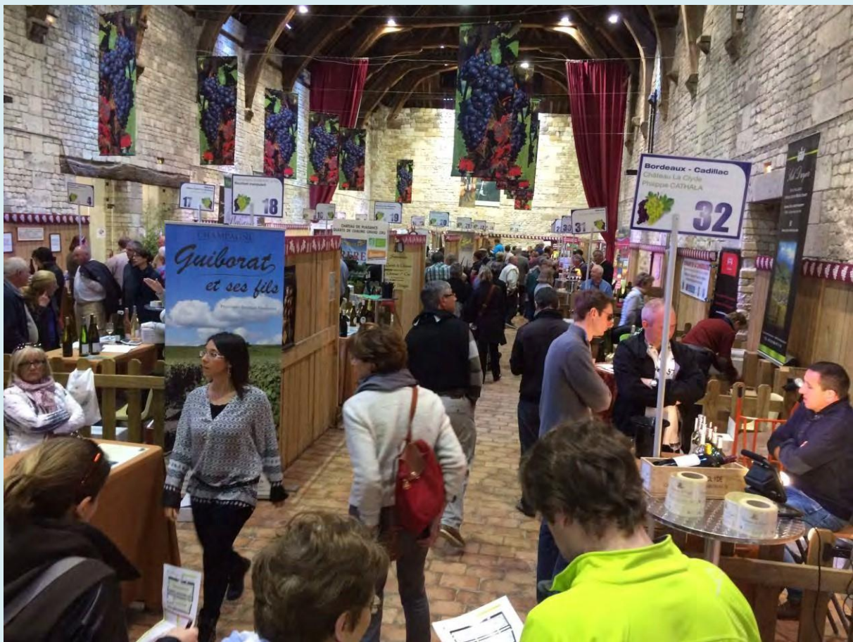
Vue du Grand Grenier à Sel

Il est enterré dans le cimetière de Honfleur, où un mausolée lui a été construit grâce à une souscription locale. Son buste trône au Jardin des Personnalités.